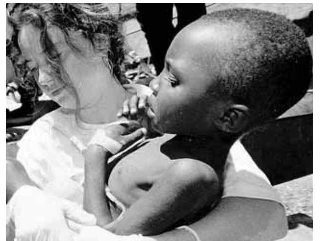
Unicef avisa del posible incumplimiento de los Objetivos del Milenio.

do por ampliar los programas de ayuda económica que sufragarían costos que, como el transporte, impedirían a los más pobres acceder a estos servicios fundamentales.