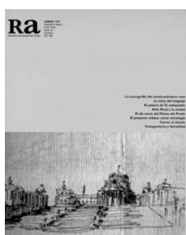
Ra 2 1998