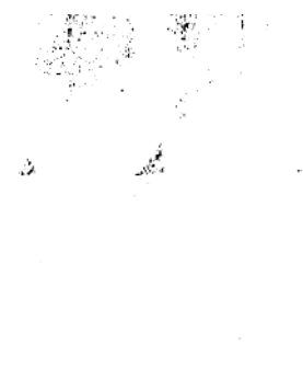
Ra 5 2003