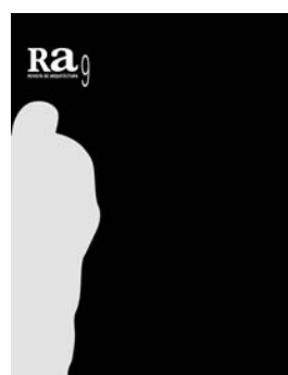
Ra 9 2007