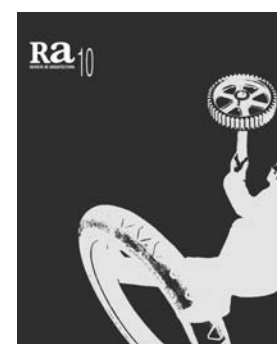
Ra 10 2008