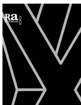
Ra 8 2006