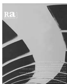
Ra 3 1999