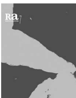
Ra 7 2005