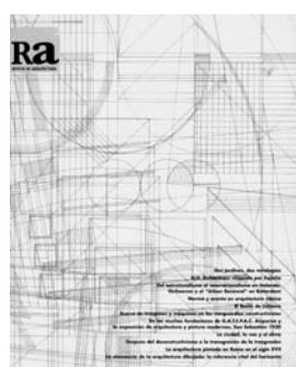
Ra 1 1997