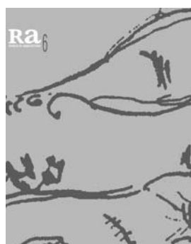
Ra 6 2004