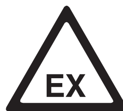
Zona con riesgos de atmósferas explosivas