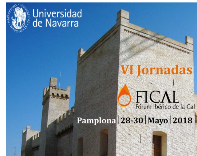
Foto: Castillo de Marcilla