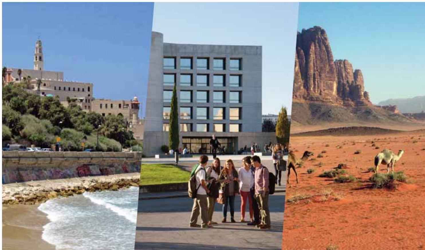
Tel Aviv, Israel.