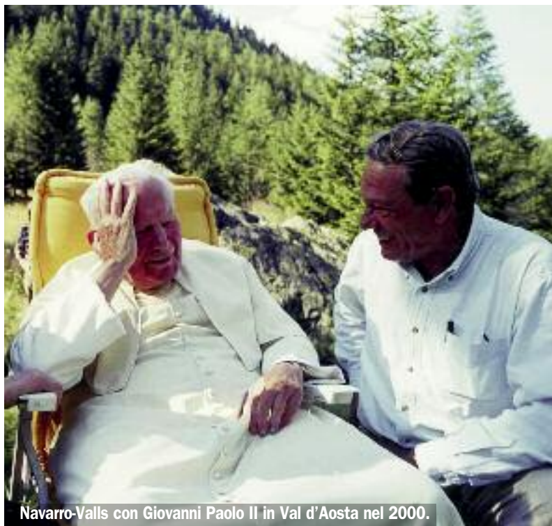
Navarro-Valls con Giovanni Paolo II in Val d'Aosta nel 2000.

tazione ma con umile orgoglio. Era un contemplativo in mezzo al mondo, tra i cavi delle tivù. Non si è mai lasciato trasportare dall'ira, dinanzi agli attacchi al «suo» Papa.