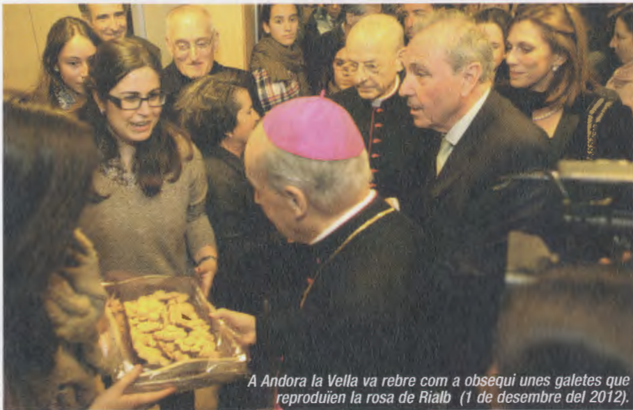
A Andora la Vella va rebre com a obsequi unes galetes que reproduïen la rosa de Rialb (1 de desembre del 2012).

Va continuar: «Els sants, en el seu pas per la terra, deixen un rastre. Els camins que ells han transitat no els hem de considerar com una gesta inimitable o una relíquia per venerar. Déu ha volgut deixar-nos aquestes vides com a exemples propers, perquè ells van veure els mateixos paisatges i van caminar per la mateixa terra que nosaltres veiem i trepitgem cada dia. Considerar els episodis de la seva vida, com estem fent avui, gràcies a l'afecte que teniu per aquest pas de sant Josepmaria per Andorra, ha de servir-nos per imitar els sants en aquelles coses que ens acosten a Déu i als altres. Els pocs dies passats a Andorra per sant Josepmaria contenen moltes lliçons. Els ensenyaments d'un home d'oració, que amb tanta pietat va aprofitar aquesta llibertat de creure i resar que Andorra li va oferir. L'exemple d'un home amant de la llibertat de tots, l'exemple d'un sant que sabia estimar, que sabia perdonar, que sabia agrair.»