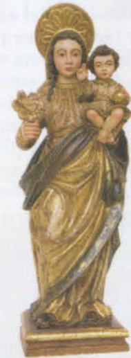
La Mare de Déu de Pallerols.