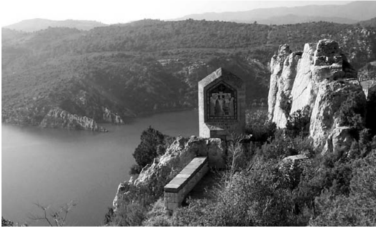
José Alzuet Aibar, Vía crucis procesional, 1985/86.

verdad se derretía en mi corazón, y con esto se inflamaba el afecto de piedad, y corrían las lágrimas, y me iba bien con ella» 26 .