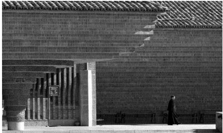
Santuario de Torreciudad. Atrio de acceso a la iglesia con las características columnas fungiformes.

The organ by Gabriel Blancafort is composed of 4.072 organ pipes plus 25 tubular bells (from G to g'). Among them, 565 belong to the choir organ and 3507 to the bigger one. Usually, the organ players accompany the Holy Mass at weekends, as well as the exhibition and blessing of the Holy Sacrament which takes place every Saturday and Sunday at 5 pm, all year round.