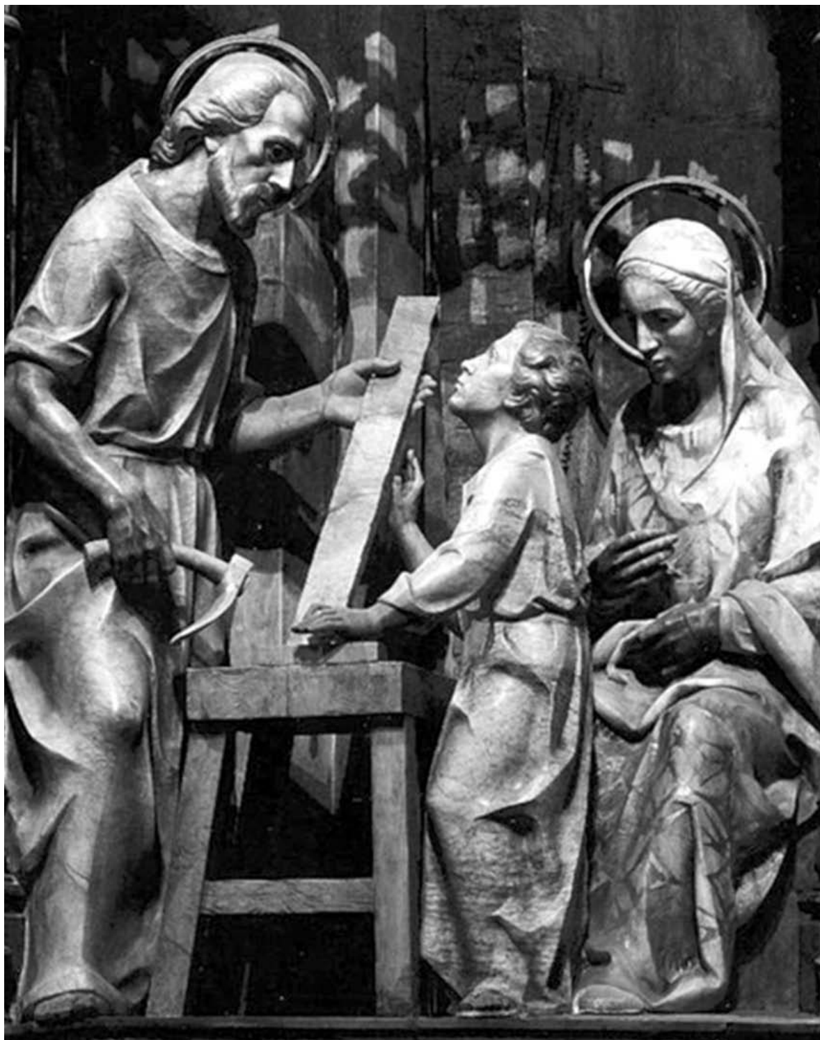
Joan Mayné i Torràs, El taller de Nazaret (detalle del retablo), 1972/75.