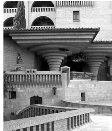
Santuario de Torreciudad. Altar al aire libre para las celebraciones litúrgicas en la explanada.