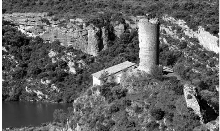
Antigua ermita de Torreciudad, con la torre defensiva.