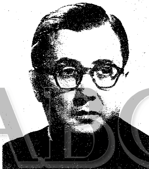
José María Escrivá de Balaguer

Magisterio eclesiástico. El criterio de la jerarquía del Opus Dei es, con respecto a sus socios, "el de respeto a la libertad de opción en lo temporal". En otros términos, "cabén en el Opus Dei personas de todas las tendencias políticas, culturales, sociales y económicas que la conciencia cristiana pueda admitir". Esta libertad se extiende a la elección de actividad: "que cada uno viva cumpliendo su vocación". Esto significa que en el ancho campo de las materias que para la Iglesia resultan opinables, dentro del Opus Dei hay multiplicidad de posiciones individuales. Monseñor Escrivá subraya: "En el Opus Dei