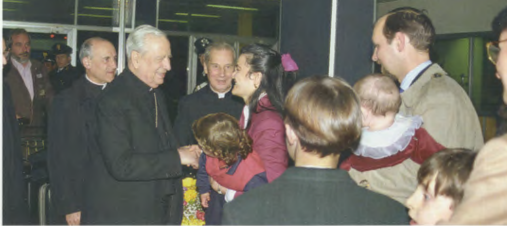
• L'ultima foto di don Álvaro il 22 marzo 1994: al suo rientro dalla Terra Santa ha avuto la lieta sorpresa di incontrare alcune famiglie che lo attendevano a Ciampino.

umana” – è l’ambito in cui l’uomo è amato per se stesso e impara a vivere “il dono sincero di sé” (n. 11). Quindi, la famiglia in quanto scuola di amore: a patto, però, che sappia conservare la propria identità, e cioè una comunità stabile di amore fra un uomo e una donna, fondata sul matrimonio e aperta alla vita. Quando vengono meno l’amore, la fedeltà o la generosità verso i figli, la famiglia si sfigura. E le conseguenze non si fanno attendere: per gli adulti, la solitudine; per i figli, l’abbandono; e per tutti, la vita diventa un territorio inospitale. Per questo, conclude Giovanni Paolo II, “nessuna società umana può correre il rischio del permissivismo in questioni di fondo concernenti l’essenza del matrimonio e della famiglia” (n. 17): parole che non sono profezia, ma constatazione. Il Santo Padre convoca tutte le famiglie, anche quelle che si trovano in difficoltà, perché siano fedeli alla propria vocazione di servizio alla vita e alla piena umanità dell’uomo, fondamento di una civiltà dell’amore.