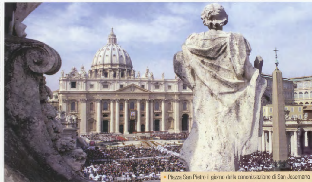
• Piazza San Pietro il giorno della canonizzazione di San Josemaría

Stralcio dell'articolo del cardinal Crescenzo Sepe, arcivescovo di Napoli, pubblicato su Il Mattino del 6 ottobre 2008. «L'Opus Dei e la santità quotidiana»