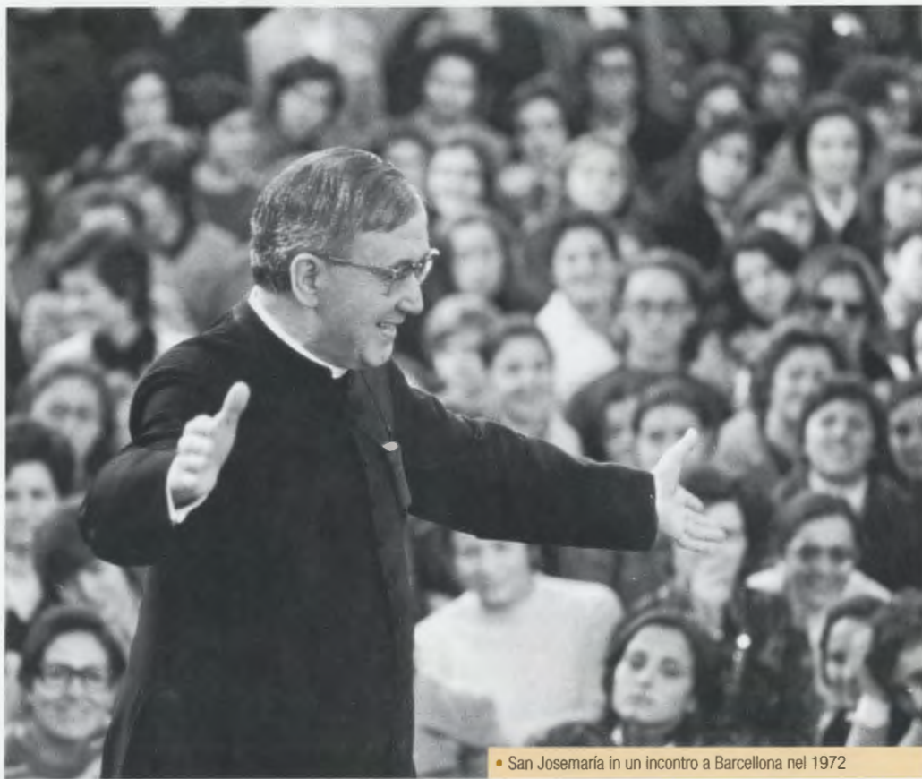
• San Josemaría in un incontro a Barcellona nel 1972

Con quella luce vide l'essenza dell'Opera - strumento ancora senza nome - destinata a promuovere il disegno divino della chiamata universale alla santità e vide come dall'interno dell'Opera - strumento della Chiesa di Dio - irradiavano i principi teologici e lo spirito soprannaturale che avrebbero rinnovato il mondo. Con immenso stupore comprese, nell'intimo della sua anima, che tale illuminazione era non solo la risposta alle sue petizioni, ma anche l'invito ad accettare un incarico divino.