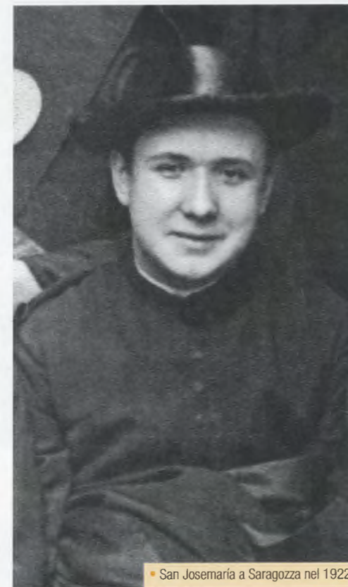
San Josemaría a Saragozza nel 1922

parlava di quanto accaduto. L'inattesa visione soprannaturale assorbiva in sé tutte le parziali ispirazioni e illuminazioni del passato, distribuite sui foglietti che stava leggendo, e le proiettava verso il