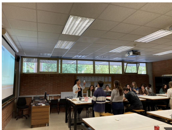
Fig.4. Sesión de explicación de equipos a los alumnos.