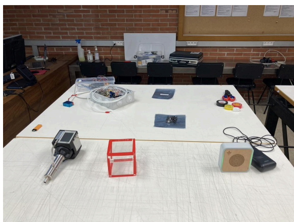
Fig.3. Preparación de mesas de explicación de equipos.