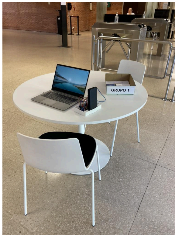
Fig.6. Ejemplo de la dinámica de toma de datos por parte de los alumnos.