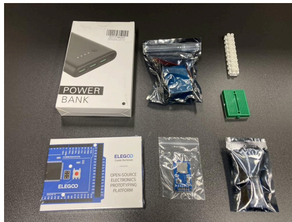
Fig.1. Componentes de los equipos de medición.

Sería deseable aumentar el número de equipos Arduino para optar a un mayor número de mediciones y realizarlas de forma más ágil entre todos los estudiantes. Por equipos ha de entenderse el conjunto necesario para el funcionamiento, es decir, no solo la tarjeta Arduino sino también las baterías, cableado y otros componentes menores.