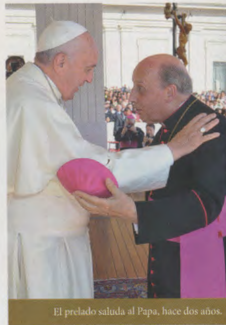
El prelado saluda al Papa, hace dos años.

El 12 de diciembre era la fiesta de la Virgen de Guadalupe, ante la que monseñor Echevarría había rezado con confianza de hijo en diversas ocasiones, una de ellas acompañando a san Josemaría, en 1970. La Providencia ha querido que también en esta circunstancia se manifestara la continuidad con el fundador: san Josemaría falleció, al entrar en su habitación de trabajo, tras dirigir su mirada a un cuadro de la Virgen de Guadalupe. Y monseñor Javier Echevarría ha sido llamado a la casa de Dios en esta fiesta de Nuestra Señora. ■