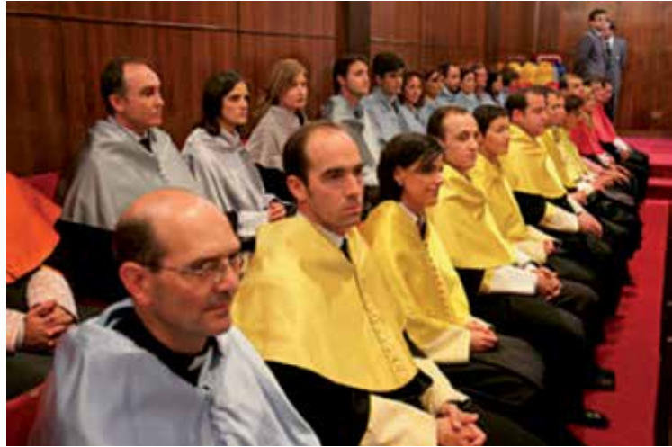
Un momento de un acto de investidura

Una antropología trascendental para la educación. (La acción educativa según el pensamiento de Leonardo Polo). Facultad de Filosofía.