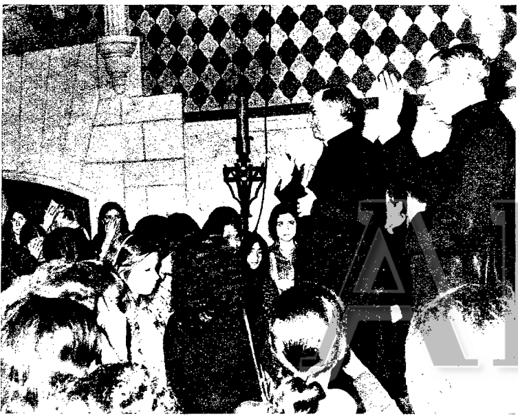
Monseñor Escrivá de Balaguer se solía dirigir a don Alvaro del Portillo, diciéndole: «Alvaro, tú que me has ayudado tanto, ayúdame también a dar la bendición».