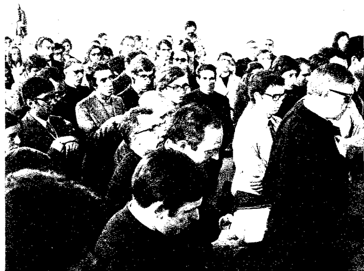
El 2 de noviembre de 1972 don José María Escrivá de Balaguer visitó Fátima. Un grupo de asociados portugueses del Opus Dei le acompañaron allí en oración.