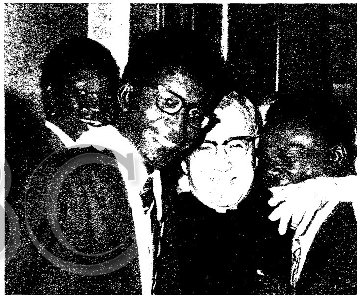
La imagen fue tomada en Roma hace dos años. Monseñor Escrivá abraza a un grupo de estudiantes venidos de Kenia, Tanzania y otros países del Africa Oriental.