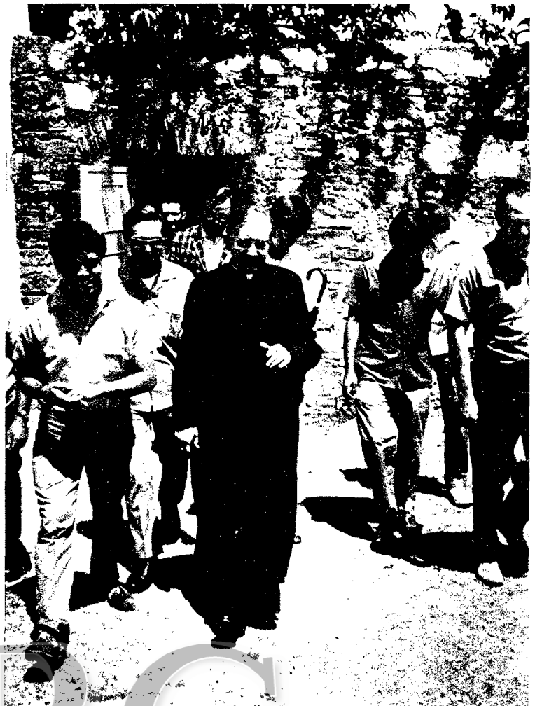
Hace poco más de cinco años, en junio del 70, monseñor José María Escrivá de Balaguer estuvo en Méjico, visitando distintos Estados. Aquí aparece en el de Morelos, en el transcurso de una catequesis impartida a los campesinos.