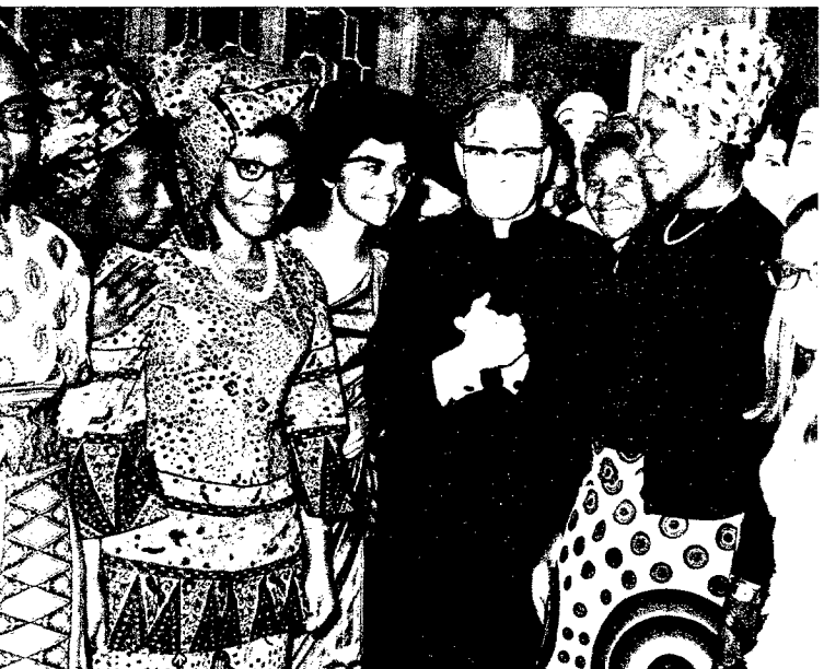
La foto corresponde a 1971. Monseñor Escrivá de Balaguer recibe en Roma a un grupo de asociados del Opus Dei procedentes de Africa, la India, Australia y Europa.