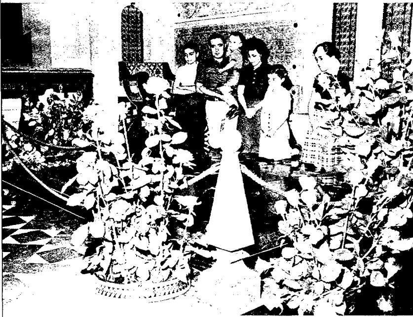
Desde el día de su muerte, centenares de personas, como esta familia, desfilan y rezan jornada tras jornada, ante la tumba del inolvidable sacerdote que fue Monseñor José María Escrivá de Balaguer.

al Papa, a los obispos, a los sacerdotes, al Magisterio eclesiástico, al culto litúrgico y a la devoción privada, y desde ahí a los hombres de toda condición porque para ellos era esa Iglesia tan amada, y mal podía ser querida ésta si no lo eran a la vez todos los que, dentro o fuera del redil, eran, en la intención del Salvador, beneficiarios de sus dones. Esto es amor a la Iglesia, quererla tal como es en sí, sin echar agua al vino, y quererla para todos.