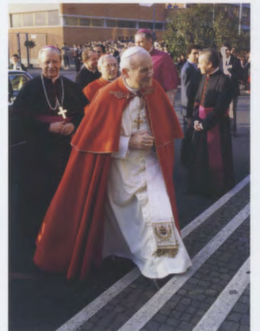
• Visita del Santo Padre al centro ELIS, Roma (1984).