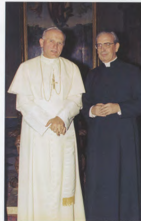
• Cartolina inviata da Gerusalemme al segretario del beato Giovanni Paolo II. • Prima udienza con il Papa Giovanni Paolo II (1978).

Uno dei compiti di mons. del Portillo come primo successore di san Josemaría fu che l'Opus Dei ricevesse la configurazione giuridica definitiva, desiderata e preparata dal fondatore.