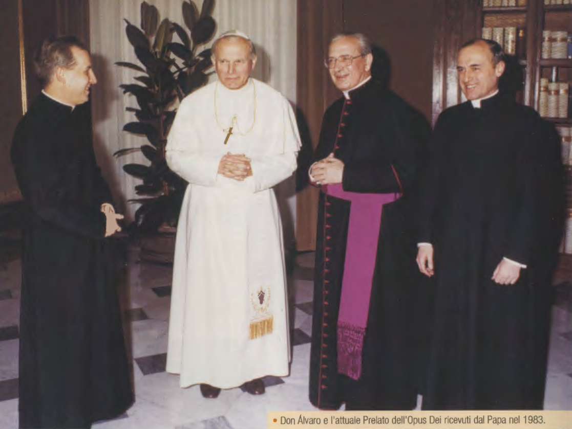
• Don Álvaro e l'attuale Prelato dell'Opus Dei ricevuti dal Papa nel 1983.

In data 28 novembre 1982, il Santo Padre Giovanni Paolo II, mediante la Costituzione apostolica Ut sit , eresse l'Opus Dei come Prelatura personale e nominò Prelato mons. Álvaro del Portillo. Il 6 gennaio 1991 gli conferì l'Ordinazione episcopale nella Basilica di S. Pietro. Non era soltanto un riconoscimento verso la persona, ma un provvedimento del tutto coerente con la peculiare missione che compete al Prelato dell'Opus Dei nella Chiesa.