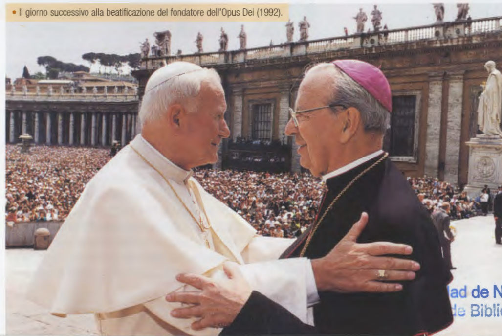
• Il giorno successivo alla beatificazione del fondatore dell'Opus Dei (1992).

vita e di efficacia apostolica nella Chiesa. Il Signore lo ha detto con la massima chiarezza: Come il tralcio non può far frutto da se stesso se non rimane nella vite, così anche voi se non rimanete in me (Gv 15, 4). Per rimanere in Cristo è assolutamente necessaria l'unione totale con il suo Vicario sulla terra, il Romano Pontefice». Il Servo di Dio ha aiutato molti cristiani a vivere l'unione filiale con il Santo Padre mediante il suo luminoso esempio di amore per il Papa, che lo ha portato a spendersi generosamente per estendere il Regno di Cristo - Regnare Christum volumus , "vogliamo che Cristo regni!", era il suo motto episcopale -, e mediante la sua predicazione incessante: «Dobbiamo essere molto romani, con il nostro amore al Successore di Pietro, e questo si manifesta nelle preghiere e nelle mortificazioni per la sua Persona e le sue intenzioni, nella fedeltà ai suoi insegnamenti e nell'obbedienza devota alle sue indicazioni». ▲