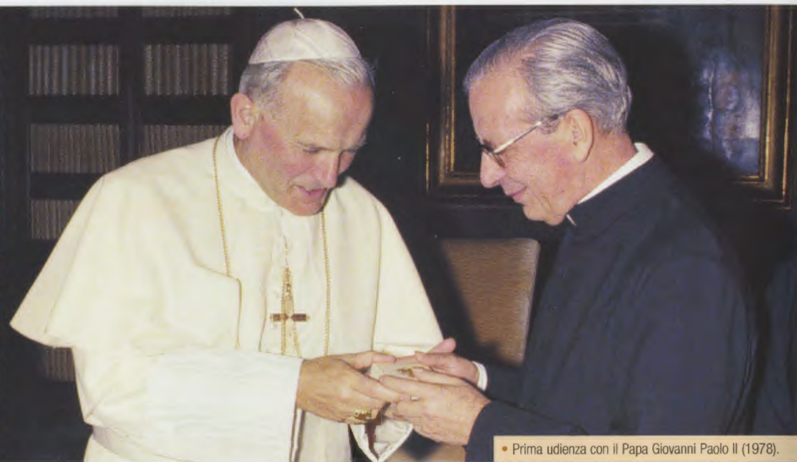
• Prima udienza con il Papa Giovanni Paolo II (1978).