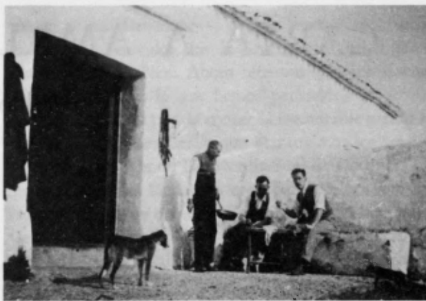
Monte Acosta. 4 enero 1948.

A los pocos días, el farmacéutico de Aracena recibía la visita de unos «turistas» extremeños, que le felicitaban por la preparación de los chicos. Él contestó sin jactancia: «Ese muchacho prestigia a todos sus profesores.»