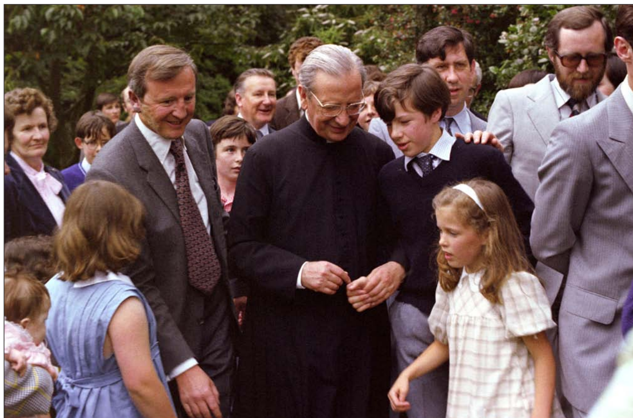
El Señor dispuso despertar entre los fieles laicos la llamada a la santidad, que no consiste en no tener defectos, sino en luchar para ser leales al Señor, en aprender a amar a Dios y a los demás superando día a día nuestro egoísmo