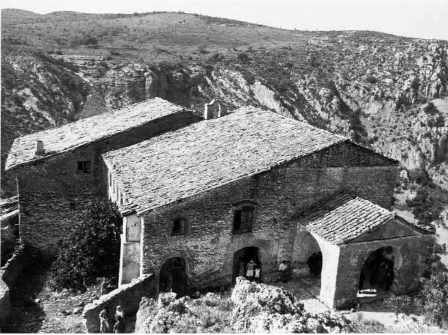
Ermita de Torreciudad. Año 1956.