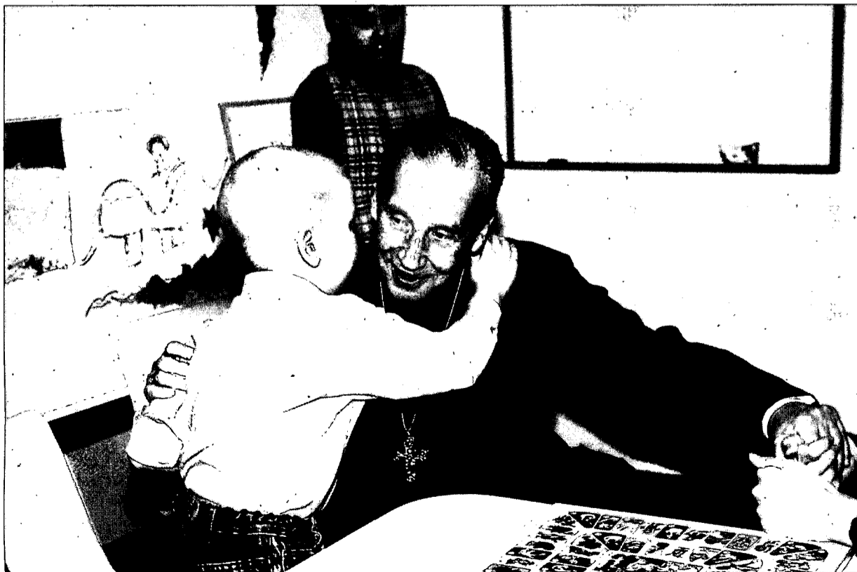
Mons. Echevarría defensa una assistència que sigui evangelitzadora.

—Se sent orgullós de pertànyer a l'única prelatura personal del món?