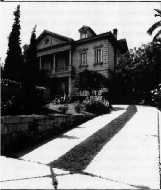
Edificio A en noviembre de 1958