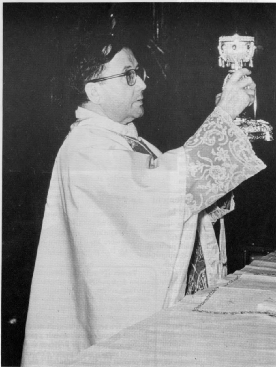
Le 31 décembre 1959 à Rome.

Au séminaire, il passait des heures en adoration devant le Saint-Sacrement. Lorsque, jeune prêtre, il se vit confier la paroisse du village de Perdiguera, en 1925, il y exposa quotidiennement le Saint-Sacrement.