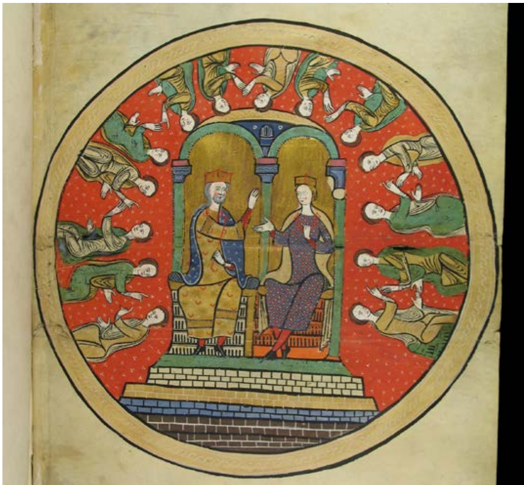
Fig 5 Alfonso II y Sancha de Castilla y Polonia según Liber feudorum maior . Archivo de la Corona de Aragón, Cancillería Real , Registro 1 (s. XII)

Existe una tradición según la cual Rica, junto con Ramón, partió a la tercera cruzada (1189-1192), acompañando a Federico Barbarroja. Rica tendría entonces unos 53 años. Ante la imposibilidad de verificarla, no sería descabellado plantear una hipótesis alternativa: que tras una larga vida en el centro de los asuntos del poder y de la más alta política, Rica haya decidido retirarse de forma incógnita en el monasterio de Santa María de Sijena , fundado por Sancha, su hija primogénita. De ser cierta, Rica recibiría sepultura en el cementerio de los donados ante la puerta sur de la iglesia monástica.