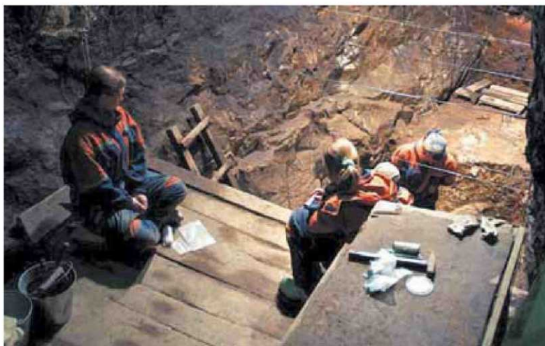
Arqueólogos trabajando en la cueva de Denisova, donde se encontraron los restos.