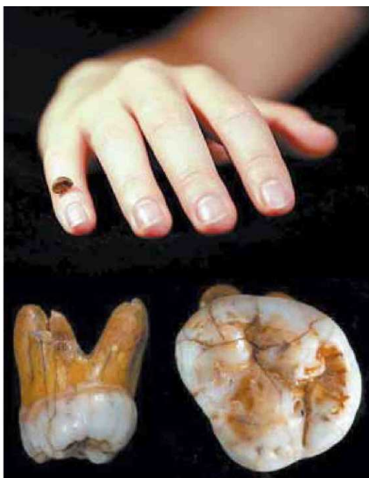
Arriba, una mujer sujeta con un dedo una réplica del resto de falange de denisovano. Abajo, el molar encontrado.