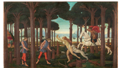
ESCENAS DE LA HISTORIA DE NASTAGIO DEGLI ONESTI, SANDRO BOTTICELLI

Jefe de Departamento de Pintura Gótica Española, Museo del Prado