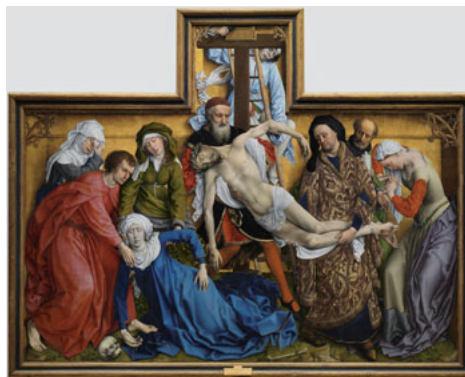
EL DESCENDIMIENTO, ROGIER VAN DER WEYDEN