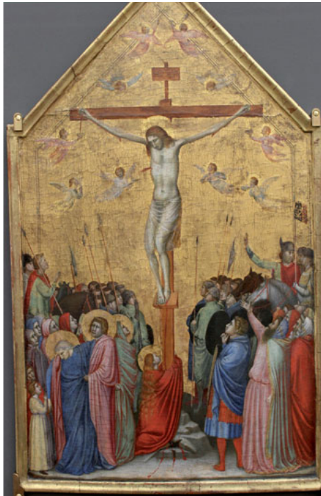
LA CRUCIFIXIÓN, GIOTTO © MIGUEL HERMOSO CUESTA [CC BY-SA 4.0]

La explosión de creatividad en todos los ámbitos de la cultura que produjo el Renacimiento convirtió al siglo XV en uno de los momentos más fascinantes de la historia de la civilización europea. En Italia, la recuperación de la Antigüedad a través del estudio de las fuentes literarias y las obras grecorromanas dio lugar a una verdadera reinención de la realidad visible. Los artistas del norte transitaron por vías diferentes, pero en muchos sentidos convergentes con las de sus homólogos del sur. A ambos lados de los Alpes se cultivaron nuevas técnicas, estilos y géneros, se representaron nuevos temas profanos y se renovaron los asuntos sagrados. Gracias a todo ello, el Renacimiento nos ha legado algunas de las obras más extraordinarias de la historia del arte. A ellas y a los artistas que las crearon está dedicado este curso.