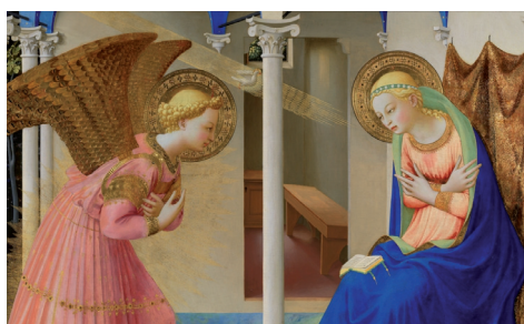
LA ANUNCIACIÓN, (DETALLE), FRAY ANGÉLICO

Cuando, después de resucitar, Cristo se apareció a los apóstoles, uno de ellos, Tomás, estaba ausente. “Al señor hemos visto”, le dijeron sus compañeros al volver a encontrarse con él, a lo que Tomás contestó que si no veía la señal de los clavos y no metía los dedos en las llagas, no creería. Ocho días después, Jesús volvió a aparecerse en medio de ellos e invitó a Tomás a que metiera sus dedos en sus manos y su mano en su costado. Cuando Tomás lo reconoció diciéndole “¡Señor mío, y Dios mío!”, Jesús le contestó: “Porque me has visto, has creído. Bienaventurados los que no vieron y creyeron”. Este curso trata de lo que a lo largo de la historia se ha dibujado, se ha pintado, se ha esculpido, en definitiva, lo que se ha hecho visible para para que creyéramos. Desde los frescos de las catacumbas de Roma a las crucifixiones de Francis Bacon, innumerables de las más importantes creaciones de la historia del arte occidental están inspiradas por las ideas, las historias y los personajes contenidos en el Nuevo Testamento. Sin su conocimiento no es posible entender dos milenios de arte, incluyendo buena parte del que no podemos considerar religioso. Este ciclo, que completa el que la Fundación dedicó al Antiguo Testamento en el curso 2015-2016, analiza esa influencia de la forma más amplia e integradora posible de mano de relevantes especialistas, nacionales e internacionales, haciendo hincapié en las artes plásticas y las colecciones del Museo del Prado.