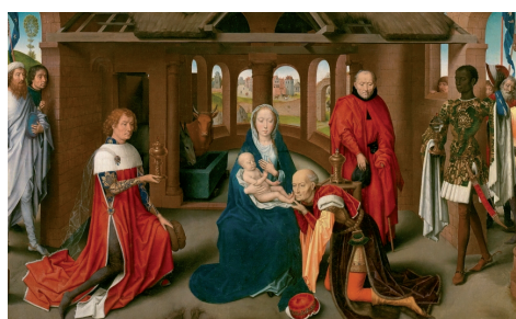
TRÍPTICO DE LA ADORACIÓN DE LOS MAGOS, (DETALLE), MEMLING, HANS.