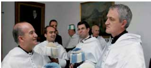
Profesores de la Facultad de Teología momentos antes del Acto de apertura de Curso