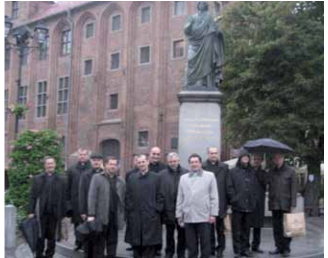
El grupo de antiguos alumnos

Uno de los frutos de esos días fue el propósito de dar estabilidad a estos encuentros. Conviene hacer notar que las ciudades de Torun y Pamplona están hermanadas en su candidatura como "capitales de la cultura" para el 2016. Además, ambas Facultades de Teología de dichas ciudades colaboran, desde hace dos años, en la participación de respectivos simposios. Piotr