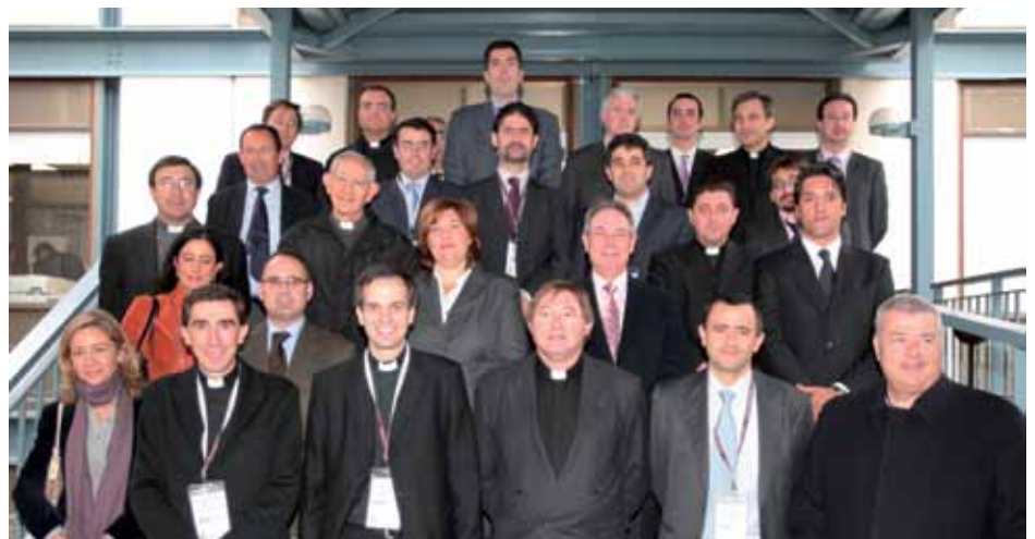
Algunos de los participantes en la Jornada de estudio

Cada Jornada del Grupo de Investigación supone el comienzo del debate interno sobre un tema, en este caso la Asignación Tributaria. Los expertos elaboran propuestas basándose en la discusión y así llegan a conclusiones y aportaciones prácticas. Otras Jornadas tratarán temas como: comunicación institucional en materia económica, inversiones de bienes eclesísticos, aspectos registrales de los bienes de la Iglesia, controles de las enajenaciones, cooperación económica del Estado con la Iglesia, etc. ■