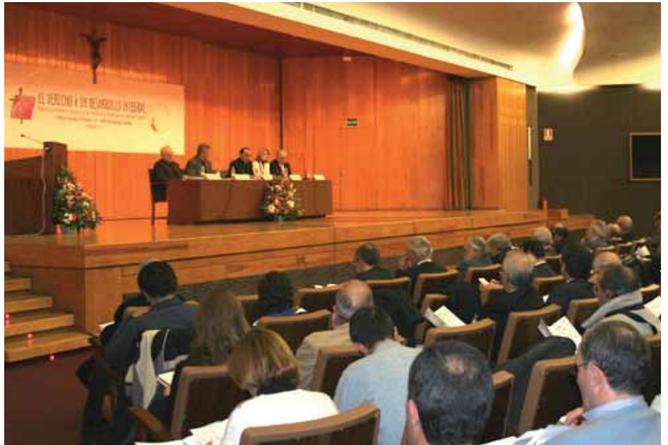
Un momento de un Simposio Internacional