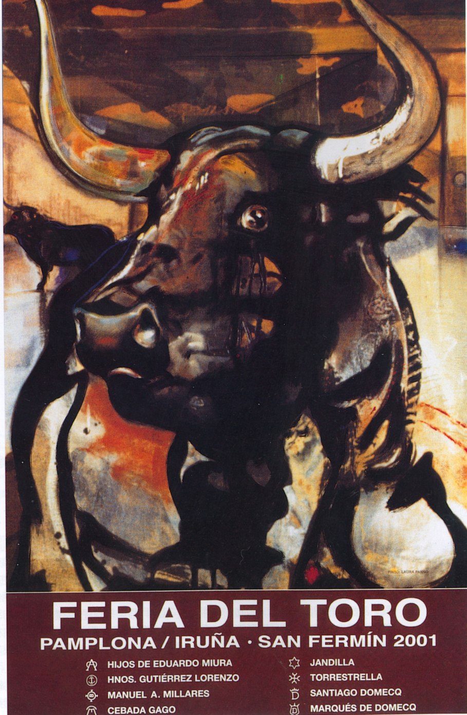
鬥牛博覽會海報 98 × 60cm 2001

告戰鬥，譬如從鬥牛場的牛欄衝出，到和鬥牛士決鬥，也有抬頭挺胸的筆直姿態，接受觀眾拋帽獻花，到場內風光出頭的場景。然而，海報中也不乏牛隻在平靜牧場草園的模樣、面對持長矛騎馬者，或與揮動披風的鬥牛士共舞。整個節慶以鬥牛為重頭戲，展現鬥牛場在西班牙午後熱情的豔陽，灑在場內及四周的沙場反映出泛白、泛紅和泛黑等眩目的色澤。歷年來不同的海報以不同的技巧、多樣的色彩使得館方收藏極為豐富，上至油彩、壓克力顏料、膠彩、拼貼、水彩、炭筆、粉蠟筆、鉛筆和水墨等，媒材同時也包括帆布、木板、厚紙卡、紙，甚至包括鋅板。就技巧方面而言也是多樣化的，包括了雕塑、版畫、攝影及廣告設計，在在為節慶增添藝術氣息。