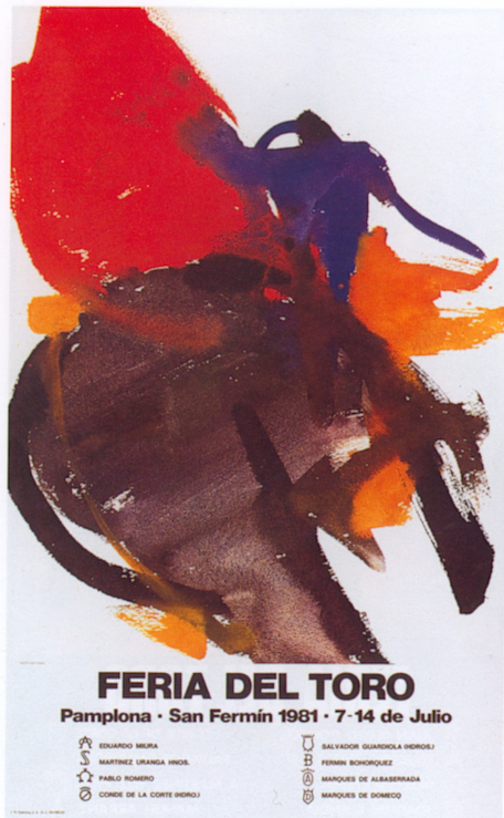
鬥牛博覽會海報 98 × 60cm 1981

(Eudardo Chillida)，甚至國際藝壇大師畢卡索和培根 (Francis Bacon)，雖然終未能留下他們的大名在海報之上，館方在 70 年代初曾和他們有所接觸。