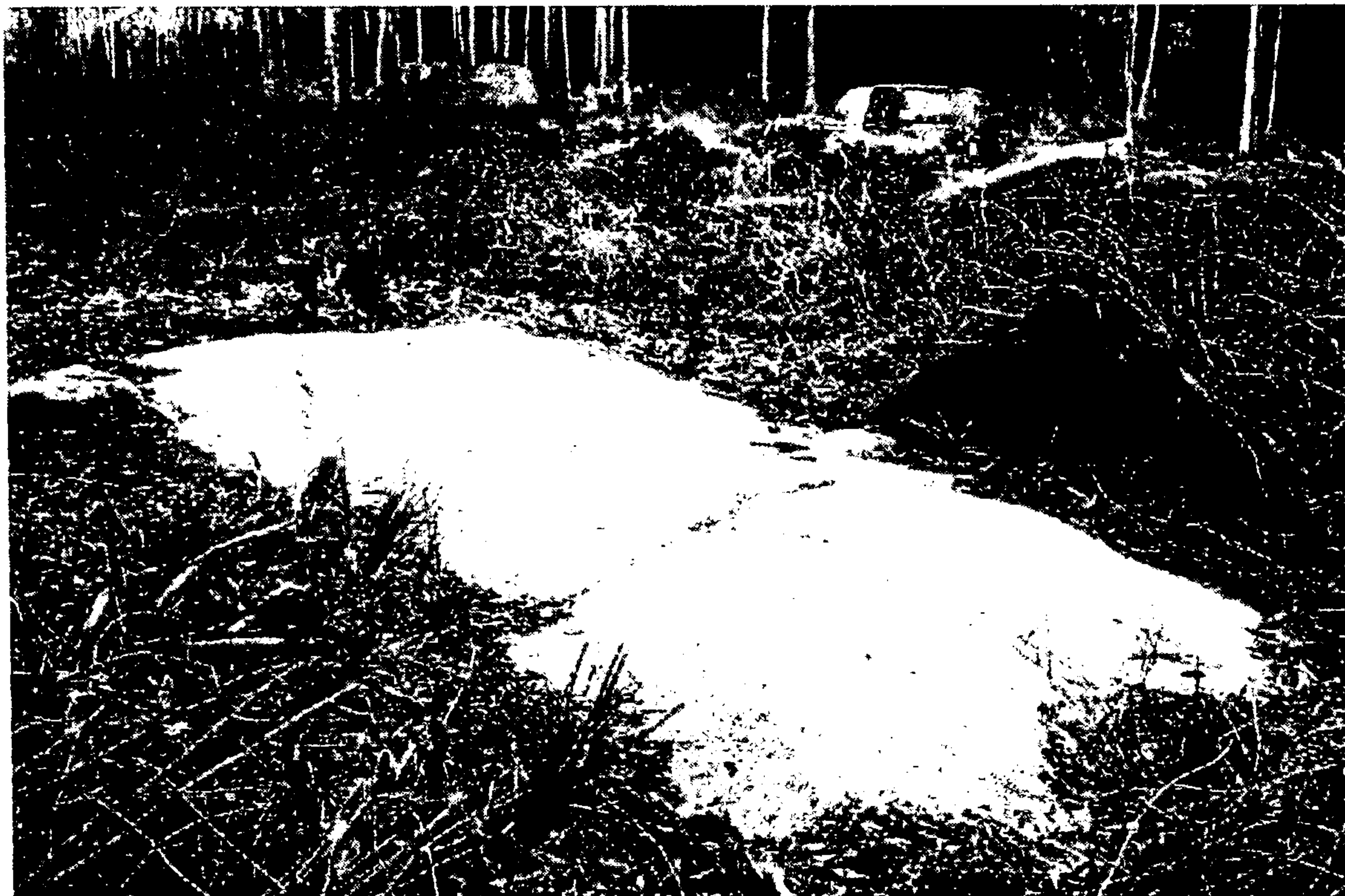
Uno de los petroglifos de Fonte do Sapo que forman parte del patrimonio prehistórico de Saiáns.

El del Monte do Castro completa el conjunto patrimonial con tres molinos de soporte fijo. En esta zona hay presencia de asentamientos