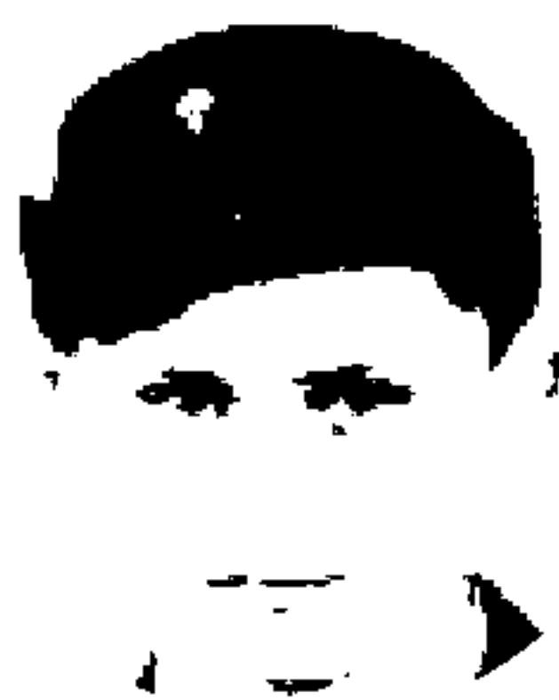
En agosto de 1947, con 17 años, fue reclutado por el ejército alemán

El autor «Me he dedicado a estudiar su pensamiento y creo que he logrado entender lo que hay dentro de su cabeza»