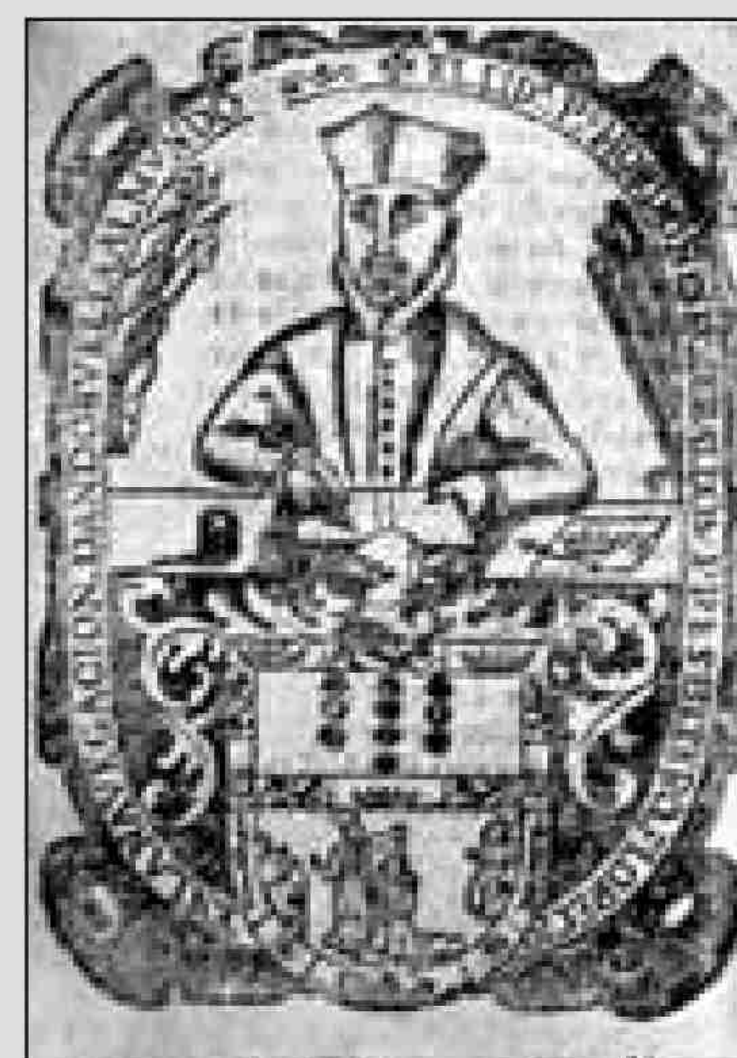
Retrato de Ordóñez de Ceballos.

> Teatro. Fascinó tanto la historia viajera del clérigo que provocó que hasta cinco comedias se basaran en sus hazañas. Es el caso de las cuatro partes de la 'Famosa comedia del español entre todas las naciones y clérigo agradecido'. El mercedario Alonso Remón autor de las dos primeras partes. La tercera y cuarta parte son de autor anónimo, pero hay muchos investigadores que apuntan a la mano del propio Ceballos. Otra obra, 'La nueva legisladora y triunfo de la cruz' la escribió el fraile trinitario Francisco de Guadarrama inspirado por las hazañas del clérigo viajero.