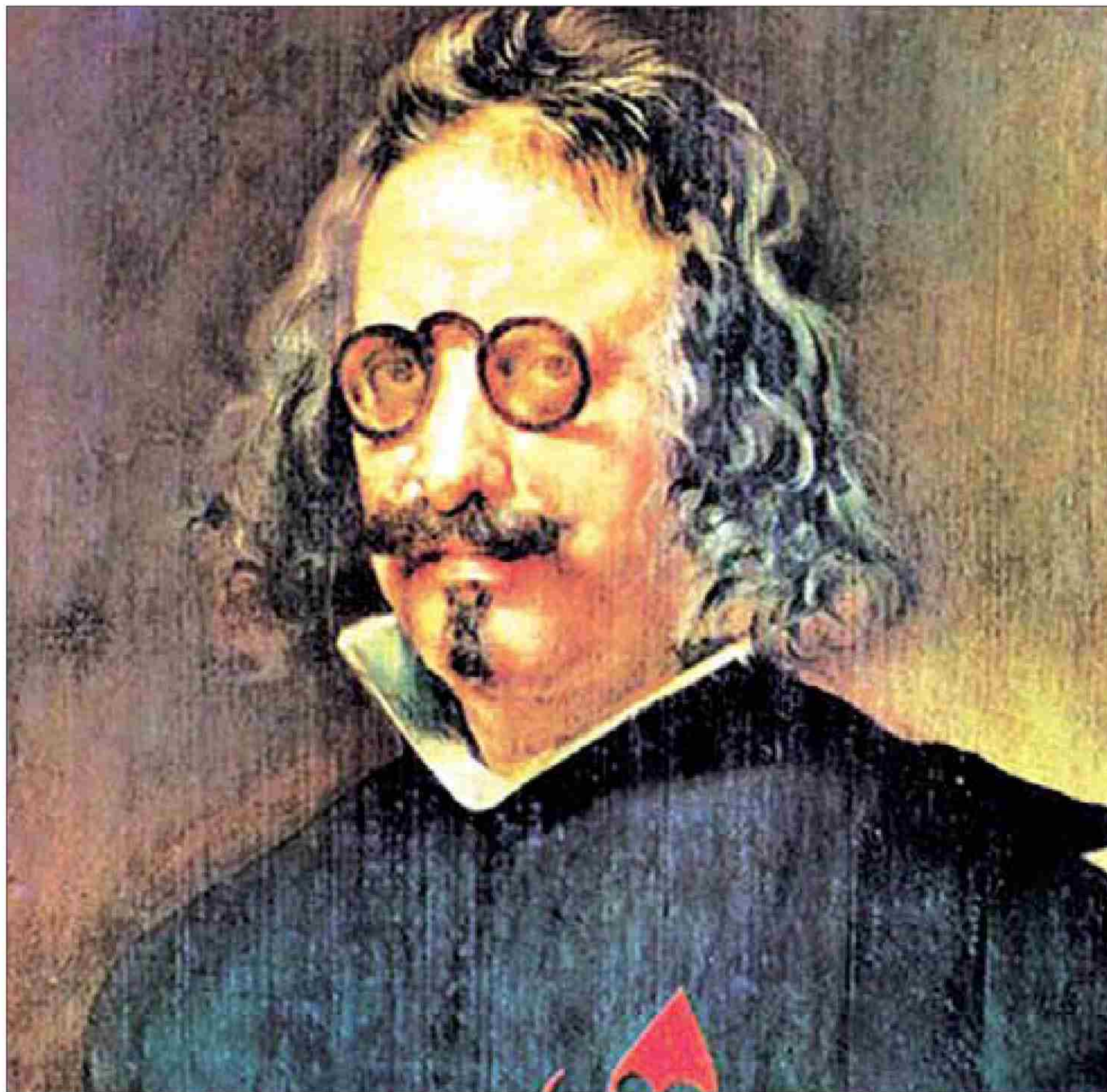
Con sus libros, el escritor madrileño siempre pretendía moralizar y divertir.

“Son pequeñas obras, casi todas ellas cómicas y