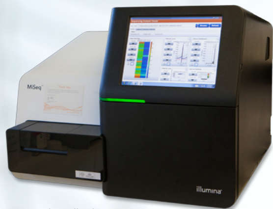
EQUIPO MiSeq, Illumina